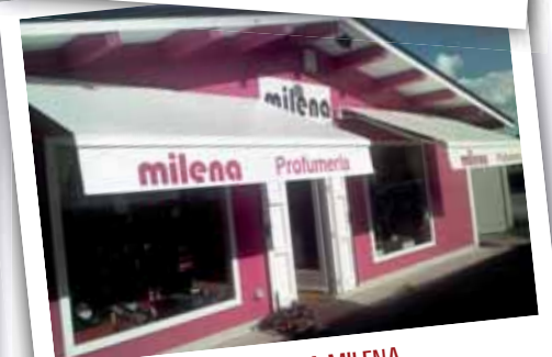
PROFUMERIA MILENA Essere in un contesto con tante altre attività favorisce il passeggio, inoltre l'arrivo dei clienti è favorito anche dalla vicinanza del CUP e delle scuole. Attendiamo ora la delimitazione dei parcheggi per rendere più sicuro l'accesso con le auto.