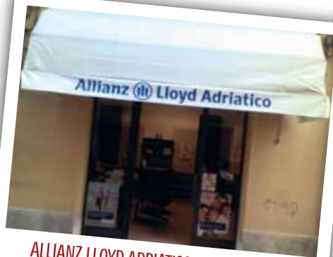
ALLIANZ LLOYD ADRIATICO ASSICURAZIONI Ho fatto molti sforzi per tornare in centro a Concordia, ma ci ho creduto fin dall'inizio e ora sono molto soddisfatto della scelta effettuata. Via Mazzini, 59 - tel. 0535 54455 - cel. 339 5472477

Prosegue nelle vie del centro storico la riapertura di attività economiche, commerciali e dei servizi che, dopo un periodo di chiusura, hanno definitivamente ripreso l'attività nella sede storica o in un nuovo spazio a seguito della riduzione della zona rossa o della conclusione dei lavori di ristrutturazione dei locali. Questa galleria fotografica rappresenta gli esercizi che negli ultimi due mesi hanno ripreso l'attività nelle vie del centro storico di Concordia. Nel prossimo numero di Concordia Comune daremo conto degli esercizi che nel frattempo riapriranno in via definitiva.