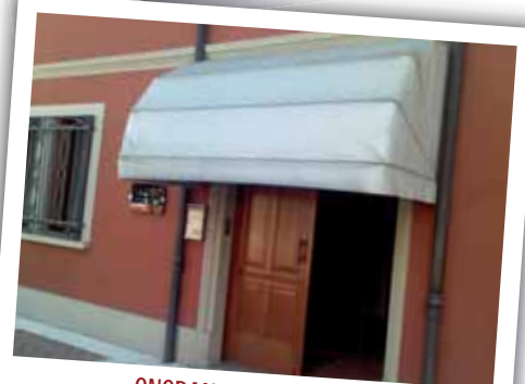
ONORANZE FUNEBRI LOSI Dopo il sisma siamo stati costretti a trasferire parte dell'attività a Moglia, ma abbiamo mantenuto un forte legame con Concordia per continuare a fornire un servizio ai nostri concittadini. Via Garibaldi, 20 - tel. 0535 54171 numero verde 800 506111