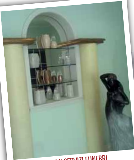
BONOMI SERVIZI FUNEBRI Sono convinto che il centro storico di Concordia tornerà ad avere un ruolo centrale nella vita del nostro Paese. Ho avuto l'opportunità di individuare questo locale adatto alle mie esigenze e ben volentieri sono ritornato in centro. Piazza della Repubblica, 26 - tel. 0535 38429