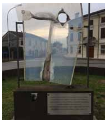
Monumento a Vallalta Dedicato alla memoria di Enea Vaini, detto "Gigin", trucidato dai tedeschi nella battaglia di Cefalonia nel 1943. La battaglia è iniziata quando la divisione Acqui con i suoi 11.000 uomini ha deciso di combattere contro l'esercito tedesco non cedendo le armi. I morti italiani furono 9.200.