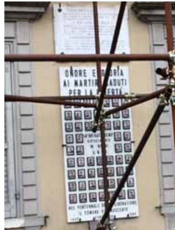
Lapide in Piazza della Repubblica Posta sulla parete dell'ex Municipio è dedicata ai martiri caduti per la libertà e alla memoria della "Quattordicesima Brigata Remo", che prende il nome dal partigiano Isolino Roversi, il cui nome di battaglia era Remo.