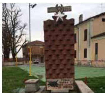
Monumento a Fossa Collocato in via Martiri della Libertà nel centro di Fossa è dedicato a tutti i caduti di guerra della frazione.