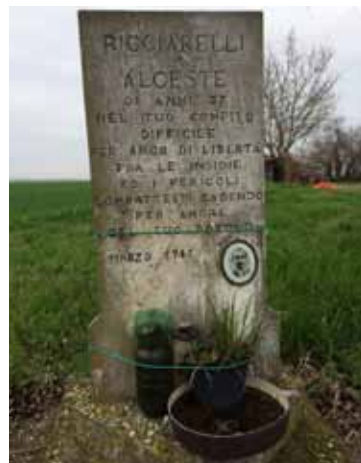
Cippo in Valdisole - Fossa Dedicato alla memoria del partigiano Alceste Ricciarelli, caduto in combattimento