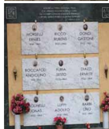
Cippo e lapide cimitero di Fossa All'interno del cimitero di Fossa si trovano un cippo e una lapide dedicati alla memoria dei partigiani uccisi.