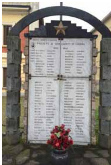
Monumento a Vallata Raccoglie i nomi dei caduti della prima e seconda guerra mondiale, principalmente quelli che hanno lottato e compiuto le missioni più importanti perdendo la vita.