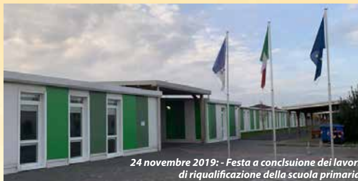
24 novembre 2019: - Festa a conclusione dei lavori di riqualificazione della scuola primaria