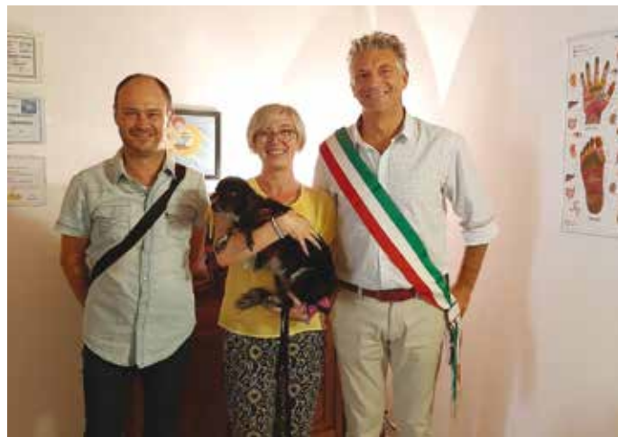
FE.BE. STUDIO TRATTAMENTI OLISTICI

Via Mazzini, 31/A - cel. 340 6272425 - Facebook e Instagram @milenaprofumeria