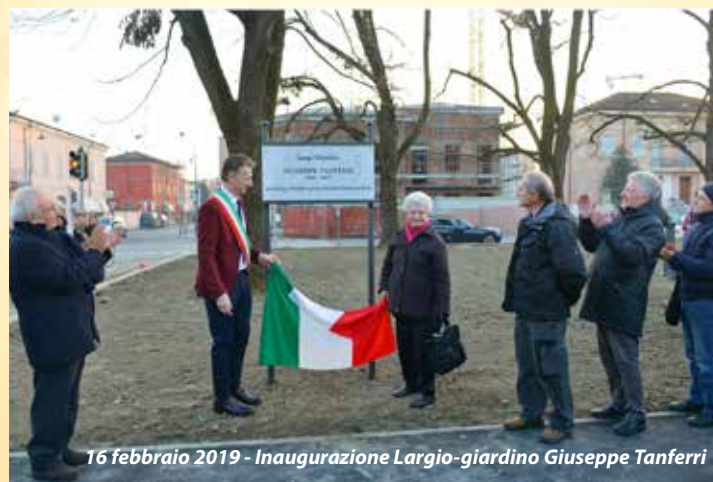
16 febbraio 2019 - Inaugurazione Largo-giardino Giuseppe Tanferri