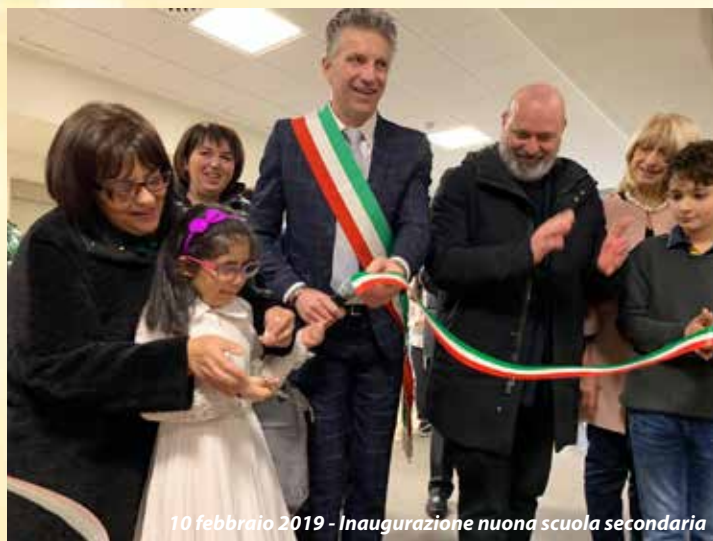
10 febbraio 2019 - Inaugurazione nuova scuola secondaria